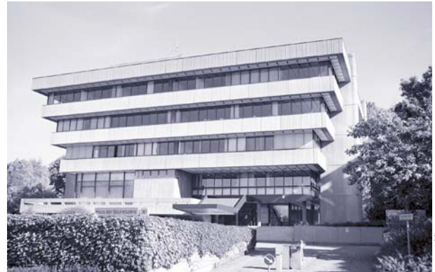
Wiesbaden, Abraham-Lincoln-Straße 30: Haus der Bauindustrie